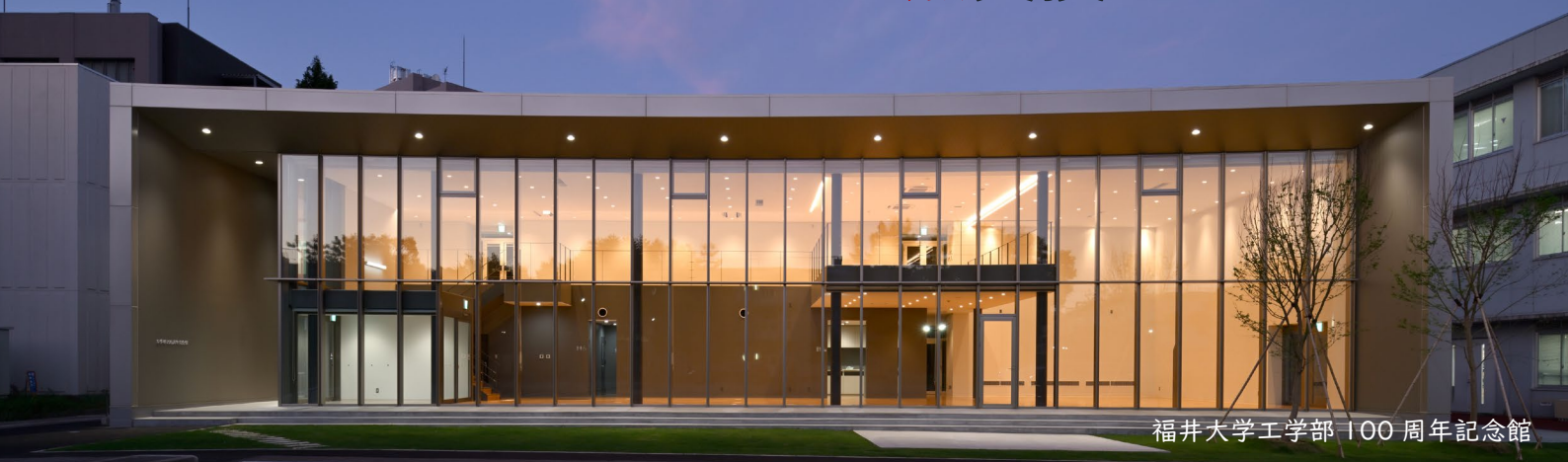
福井大学工学部100周年記念館

日本冷凍空調学会 熱交換器 PJ 委員会*が福井大学で開催されます。熱交換に関わる国内の研究者・技術者との交流する機会を計画しましたので、多くの皆様の参加をお待ちしております。新設されました『福井大学工学部100周年記念館の空調設備』の見学会ならびに『意見交換会(懇親会)』も実施します。